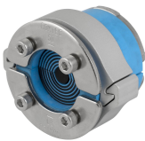
C RS SLO-Dichtung

Weitere Informationen finden Sie unter www.roxtec.com .